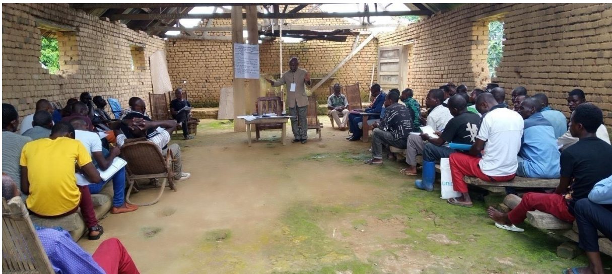
Participants à l'Assemblée communautaire des Basengele sur la définition des objectifs de gestion de leur CFCL