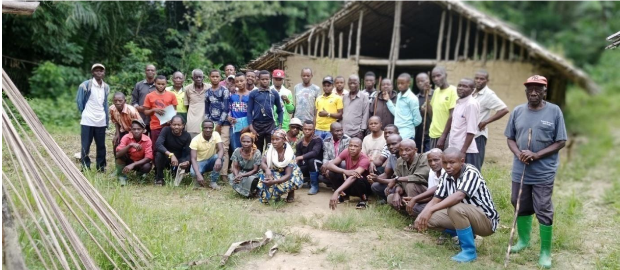
Participant à l'Assemblée Communautaire de la CFCL Bananzigha sur la définition des objectifs de gestion de leur CFCL