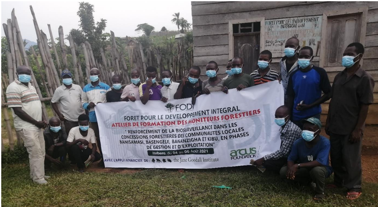
Moniteurs forestiers ayant participé à la formation sur la récolte des données de la biodiversité dans les CFCL