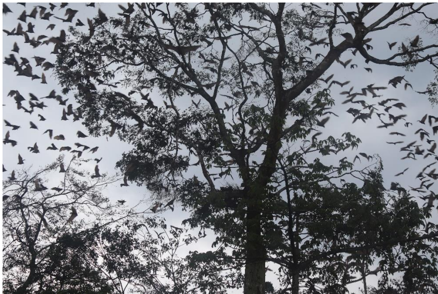
Arrivée massive des chauves-souris dans la CFCL Banisamasi sur des arbres proches du village Tusoke, un danger pour la santé publique