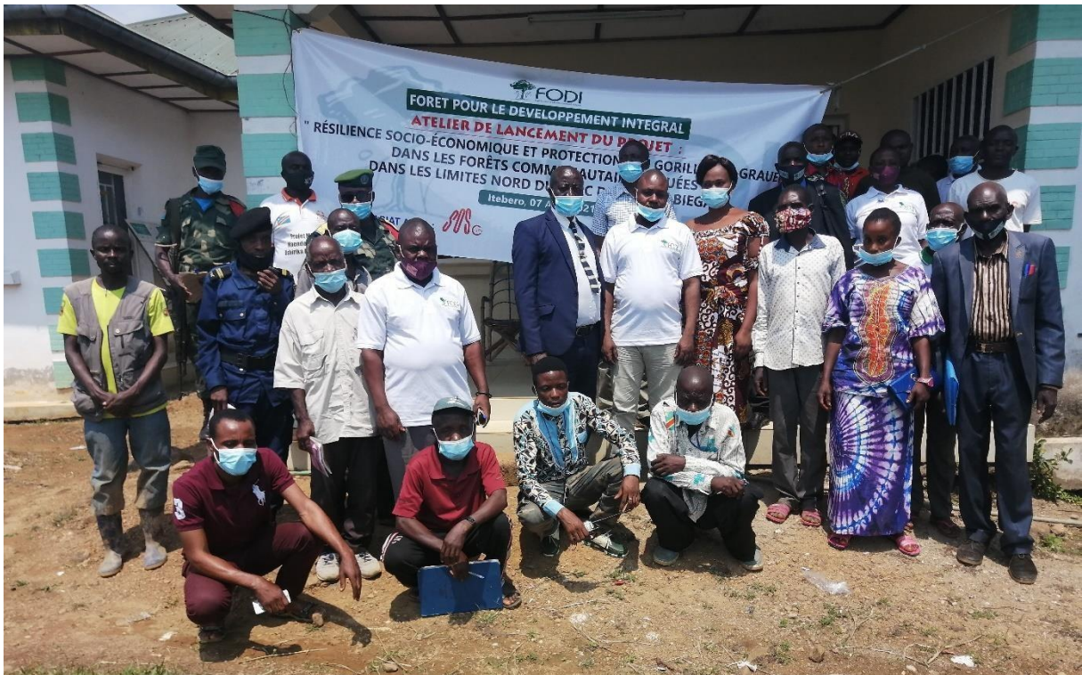
Participants à l'atelier de lancement du projet appuyé par l'IUCN SOS